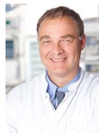
Prof. Dr. med. Andreas de Weerth

Fachabteilungsschlüssel: 0100 0102 0103 0105 0106 0107 0108 0114 0151 0152 0153 0200 0300 0500 0600 0607 0700 0706 0800 1400 3600 3601 3603 3751 3752 3753