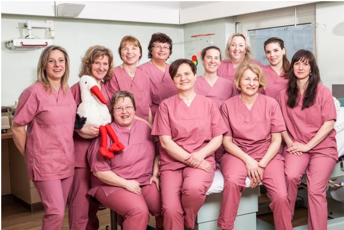
Von Beruf Glücksbringer: Die Hebammen des AGAPLESION BETHESDA KRANKENHAUS

Dem wohl schönsten Ereignis in einem Krankenhaus widmet sich die Bethesda Geburtshilfe, wo jährlich etwa 800 Babys das Licht der Welt erblicken. Ein Team von Hebammen, Ärzten, Ärztinnen, Stillberaterin und Schwestern steht Eltern und Kind während des gesamten Aufenthaltes hilfreich zur Seite. Mit einer breiten Palette verschiedener Kursangebote vor und nach der Geburt gewährleisten sie eine engmaschige, individuelle Betreuung während des Aufenthaltes.