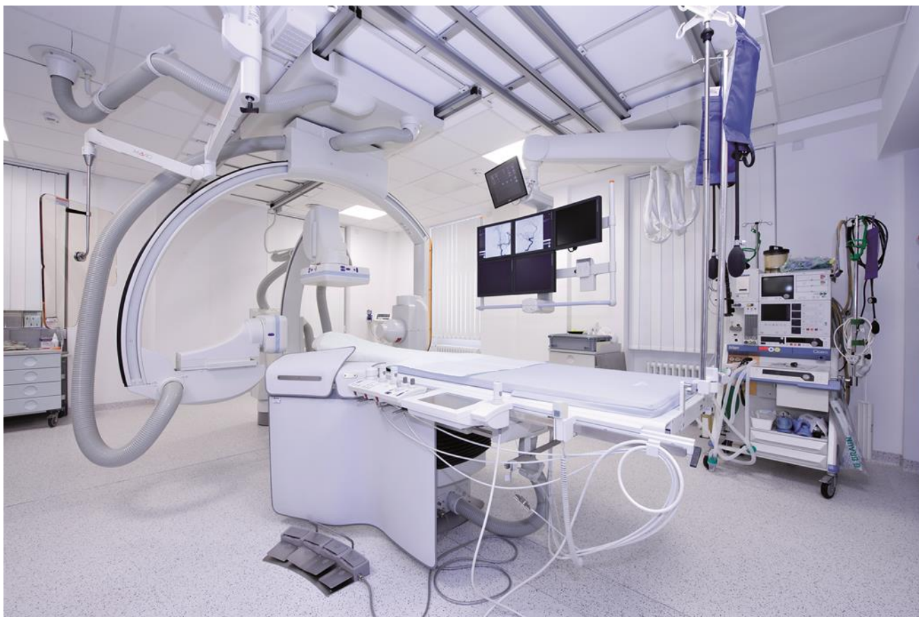
Die Angiografieanlage, eine der modernsten in NRW, ist das Herzstück der Klinik für Angiologie und interventionelle Gefäßmedizin